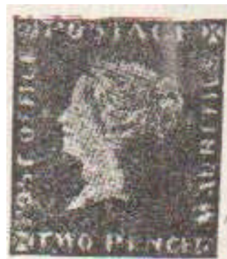
Modrý Mauritius POST OFFICE 1847 číslo XIV – neupotřebený

Zdá se vám už samotný nadpis absurdní a bláznivý?