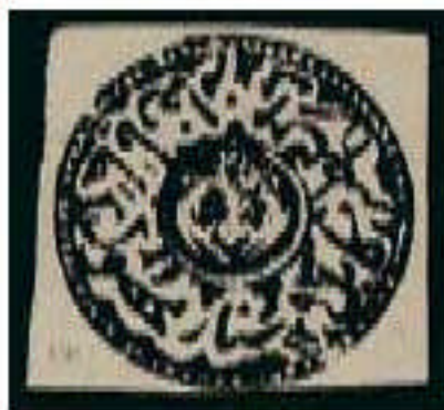
Černé vydání známky Afghaništánu (Království Kábul 1876, nominál 1 sanar)