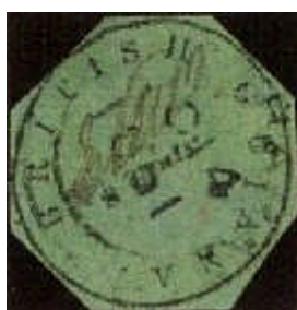
Mi.3 – 8 centů