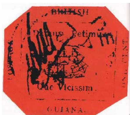
Slavná jednocentovka – unikát Mi. 9 Katalog v r. 1985 – 2.200.000 MiM