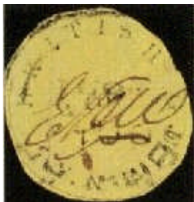
Mi.1 – 2 centy

Tisk zajistila místní tiskárna Royal Gazette v hlavním městě Georgetown. Tato první emise patří k velkým světovým raritám. Zvláště hodnota 2 centy vydaná 1.3. 1851 (na světlerůžovém papíru) měla katalog 250.000MiM v roce 1985 dle Michela.