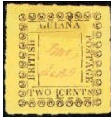
Mi. 22 – 2 centy

Touto emisí bychom mohli uzavřít období vzácných známek, protože ceny všech vyobrazených známek se pohybují ve stovkách, tisících a v případě Mi.9 dokonce milionech amerických dolarů.