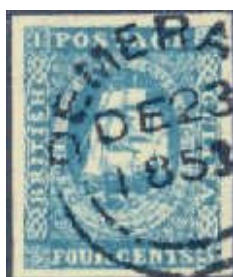
Mi.8 – 4 centy