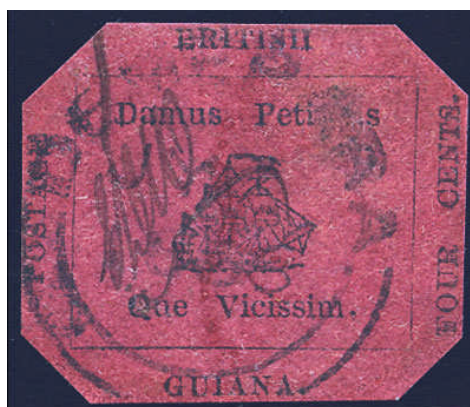
Čtyřcentovka – Mi.10 Katalog v r. 1985 – 22.000MiM

Tato emise byla vytištěna opět v Britské Guyaně v Georgetownu z důvodů, že se zpozdíly známky objednané ve Velké Británii. Emise se tiskla u firmy Joseph Baum a William Dallas. Písmena jsou použita ze sazby pro místní časopis a pro obrázek lodi zase štoček, který v časopise Official Gazette sloužil jako hlavička k sloupku o námořních zprávách. Bohužel se nezachovala žádná objednávka ani účet za tisk provizorních známek, což vede k mnoha spekulacím. Jedna z dalších spekulací je názor grafologa, že podpis EDW (poštovní úředník E.D. Wight) neodpovídá jeho jiným podpisům. Výše nákladu též není známa.