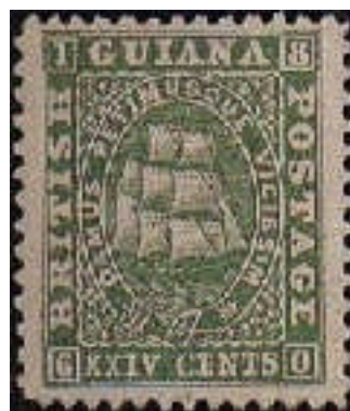
Mi.20 – 24 centů

Šestá emise z roku 1862 byla tvořena 3 nominály – 1, 2 a 4 centy. Uprostřed zůstalo volné místo pro podpis poštovního úředníka. Další zajímavostí je, že podle různých tvarů ornamentů je popsáno 6 typů těchto známek.