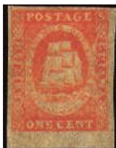
Mi.7 – 1 cent

Třetí emise vyšla v roce 1853 opět v nominálech 1 cent a 4 centy. Tyto známky byly vytištěny ve Velké Británii v tiskárně Waterlow a Sons. Na první pohled je vidět, že kvalita tisku je vysoká, úplně někde jinde než první primitivní tisky.