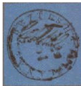
Mi.4 – 12 centů

I v této velmi vzácné první emisi se vyskytly chybotisky např. dvoucentovka na modrém papíru, což samozřejmě ještě zvýšilo hodnotu těchto známek.