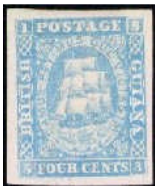
Mi.17 – 4 centy

Tato emise vycházela v letech 1860 – 1863. Zajímavé je, že nominál 6 – 24 centů byl vytištěný římskými číslicemi (např. XXIV = 24 centů). Objevilo se též první zoubkování 12 ½ : 13 u vydání z r. 1863.