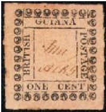
Mi. 21 – 1 cent