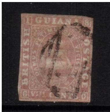
Mi.18 – 8 centů