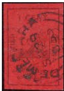
Mi.5 – 1 cent

Druhá emise byla vydaná 1.1.1852 ve 2 nominálech – 1 cent a 4 centy. Opět se jednalo o černý tisk na barevném papíru (karmínový a modrý).