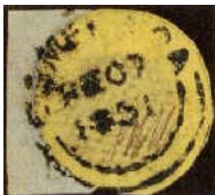
Mi.2 – 4 centy